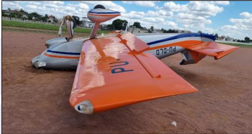
Figura 1 - Vista do PU-DLD no local do acidente.

Durante o pouso em SDRK, após cruzar a cabeceira 21, a aeronave tocou bruscamente o solo com o trem de pouso dianteiro, ocasionando a sua quebra, e pilonou.