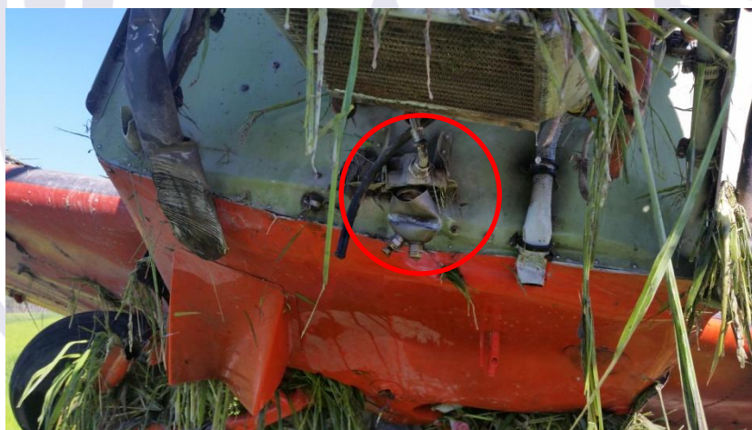
Figura 1 - Danos no filtro de combustível.

Quanto à perda de potência, foi verificado que a colisão contra o fio de energia elétrica causou um dano no filtro de combustível, posicionado na parte inferior do motor (Figura 1).