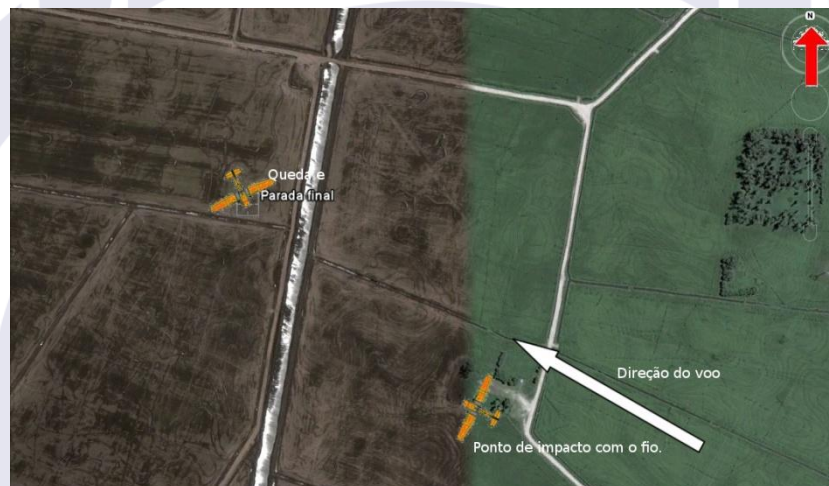
Figura 3 - Posição de parada da aeronave.