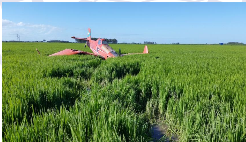
Figura 4 - Vista geral da aeronave.