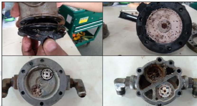
Figura 2 - Bomba de combustível do PT-UFA, com evidências de processo corrosivo.

Da mesma forma, o servo injetor de combustível apresentava indícios de contaminação por partículas sólidas, bem como evidências de processo corrosivo em curso (Figura 3).