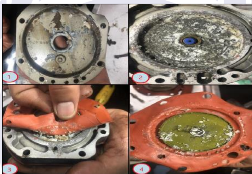
Figura 3 - Servo injetor desmontado no flange do seu diafragma.

Da mesma forma, o servo injetor de combustível apresentava indícios de contaminação por partículas sólidas, bem como evidências de processo corrosivo em curso (Figura 3).