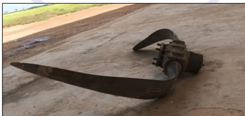
Figura 6 - Estado geral da hélice do PT-UFA após o acidente.

Adicionalmente, as deformações observadas nas pás da hélice indicaram deflexões para trás, indicando que o motor não desenvolvia potência no momento do impacto (Figura 6)