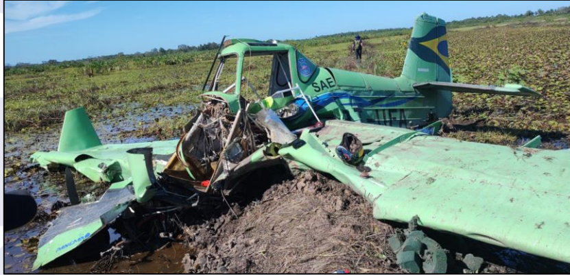
Figura 1 - Vista do PT-UFA no local do acidente.

Durante a operação, a aeronave perdeu altura e colidiu contra o terreno.