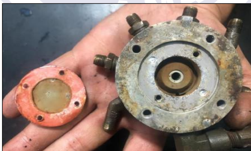
Figura 4 - Distribuidor de combustível.

A distribuidora de combustível mostrou evidências de processo corrosivo em desenvolvimento (Figura 4).