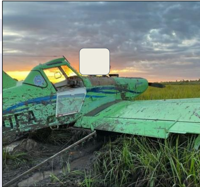
Figura 7 - PT-UFA após o suposto pouso forçado.

Nessa perspectiva, é importante destacar que, segundo seus familiares, o PIC relatou que, no dia 10JUN2022, havia sofrido uma falha de motor no PT-UFA, durante a decolagem. Na oportunidade, a aeronave ultrapassou os limites longitudinais da área de decolagem. A Figura 7 registra o PT-UFA no local do suposto pouso forçado ocorrido no dia 10JUN2022.