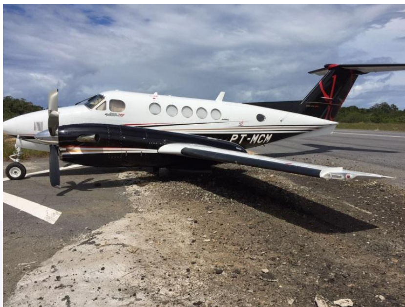
Figura 2 - Vista lateral da aeronave após a parada total.