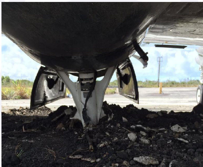
Figura 5 - Vista traseira dos danos ao trem de pouso principal esquerdo após o acidente.