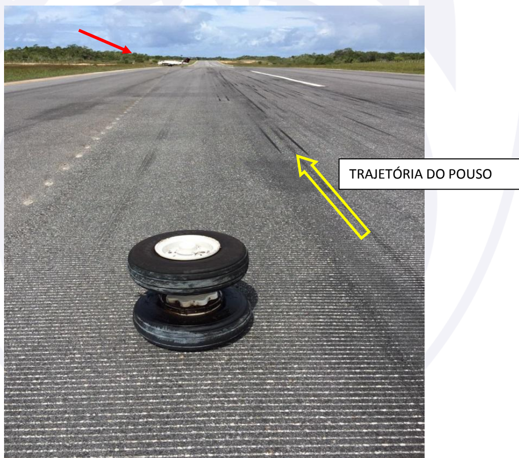
Figura 3 - Roda do trem de pouso principal esquerdo e aeronave ao fundo.