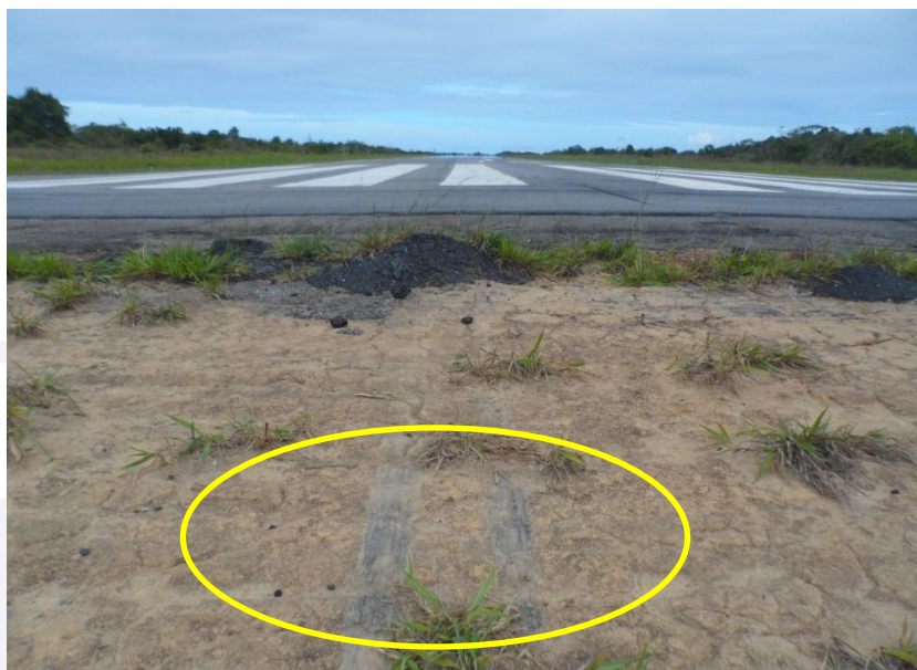
Figura 4 - Marcas do toque no solo do trem de pouso principal esquerdo.