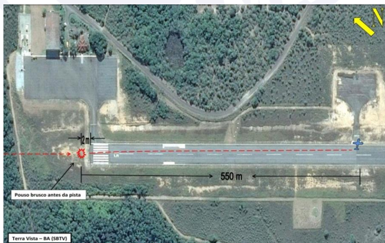
Figura 6 – Trajetória da aeronave durante o acidente em SBTV.