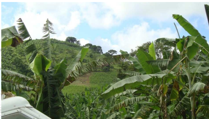
Figura 2 - Vista da fição reposta após o acidente. |