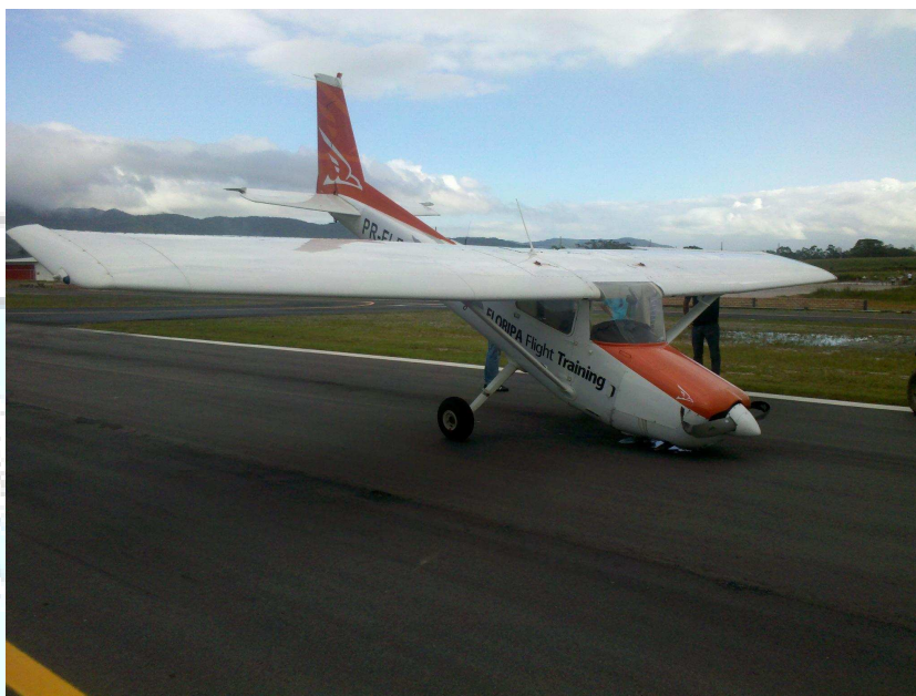
Figura 1 - Posição de parada da aeronave sobre a pista.