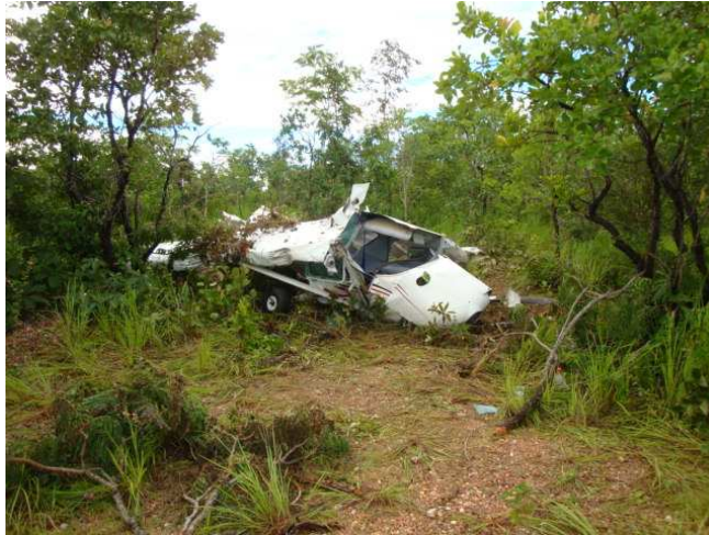
Figura nº1 Situação dos destroços.

Os destroços da aeronave ficaram concentrados, em área plana.