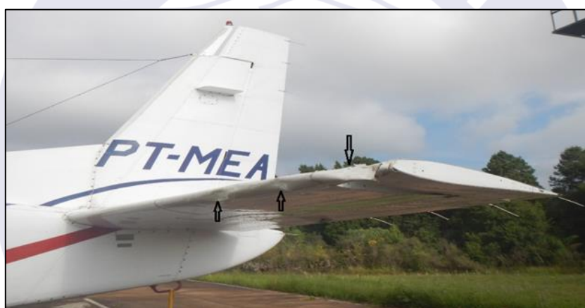
Figura 4 - Avarias no estabilizador horizontal esquerdo.

As condições meteorológicas no momento da ocorrência não impediam a operação visual de SBPC, apesar da existência de algumas formações na altura mínima prevista na carta VAC, como se pode observar na sequência das observações meteorológicas de SBPC do dia (SPECI e METAR):