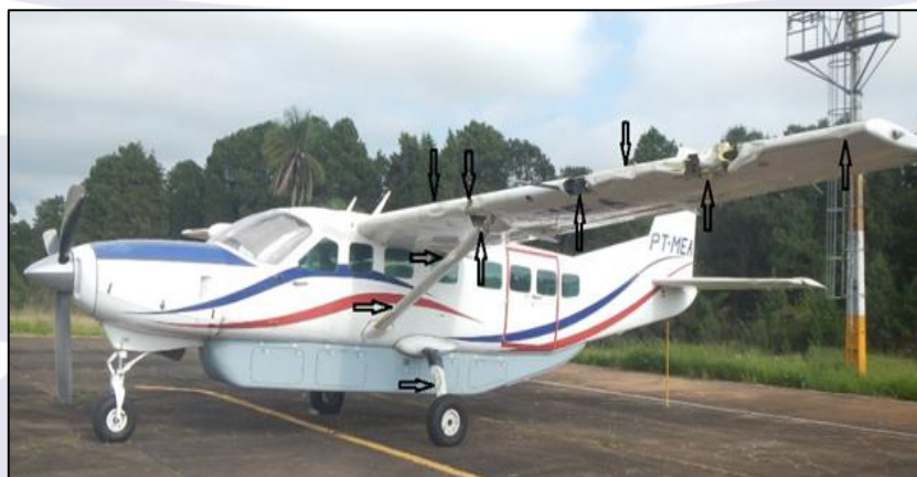
Figura 3 - Danos na asa esquerda, no trem de pouso principal esquerdo e no montante da asa.

Após o pouso, a tripulação constatou que as avarias não se limitaram à asa esquerda. O montante da asa esquerda, a estrutura do trem de pouso esquerdo e o estabilizador horizontal esquerdo também foram afetados, vide Figuras 3 e 4.