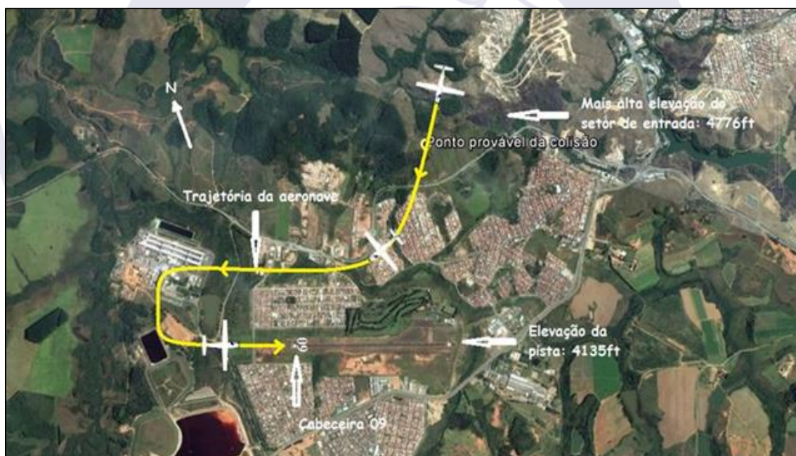
Figura 2 - Croqui da trajetória da aeronave.

A trajetória descrita pela aeronave desde o momento da ocorrência até o pouso pode ser visualizada no croqui constante da Figura 2, abaixo: